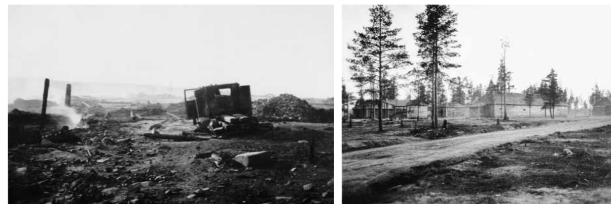
Repolassa oli majoittunut vastustajan JR 337:n esikunta. Vetäytyessään 8.7.1941 aamupäivällä se oli sytyttänyt kylän tuleen. Muutamia rakennuksia säästy palossa, kuten kylän laidalla sijainneet kasarmirakennukset.

Repola saavutettiin ilman taistelukosketusta 8.7. noin kello 14.30. Ainoastaan muutamia laukauksia kuultiin kylän itäpuolelta. Kylään oli saapunut jo vähän aikaisemmin Jalkaväkirykmentti 31:n jääkärijoukkue, mutta osasto ei tavannut sitä eikä siitä tiedetty mitään.