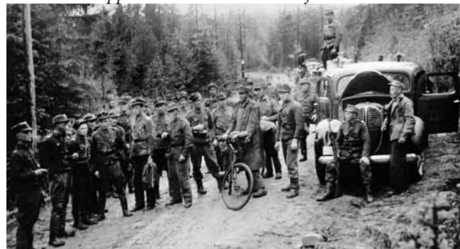
Esikuntakomppanian miehiä lähellä rajaa 7.7.1941.