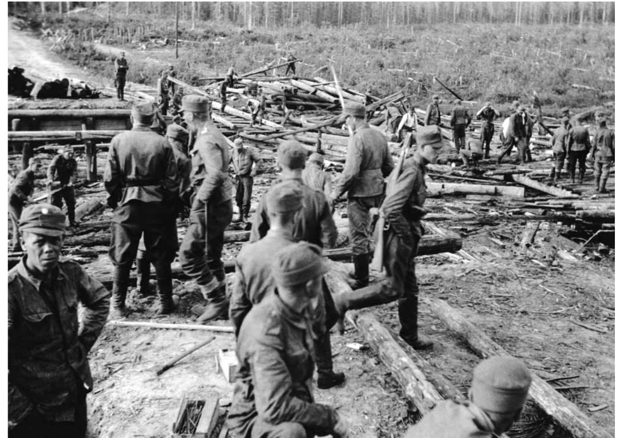
Räjätettyä siltaa kunnostetaan Repolan länsipuolella 8.7.1941. Taustalla vihollisen vesistökapeikkoon raivaamaa ampuma-alaa murrosteineen.

Jälkeenpäin voidaan todeta, että Virran kapeikon nopea ylitys, ilman raskaan tulen tukea ja vähillä patruunoilla, oli jopa yltiöpäisen rohkea suoritus. Se säästi kuitenkin suomalais-ta verta. Jos vihollinen olisi ehtinyt rauhassa valmistella puolustuksensa salmen itäpuolelle, olisi ylitys ollut erittäin vaikea tehtävä. Kolvasjärveltä lähtö tapahtui nopean ruokailun ja valmistelujen jälkeen 8.7. kello 12.15 järjestyksessä: ensimmäinen komppania, toinen komppania, konekiväärikomppania, ajoneuvot ja esikuntakomppania kolonnineen.