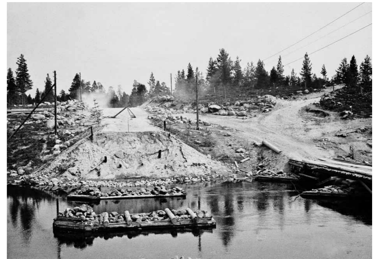
Virransalmen itärantaa kuvattuna 26.7.1941. Tältä paikalta salmen ylitti veneillä ensimmäisenä 8.7.1941 illasta Kevyt Osasto 2:n toisen jääkärikomppanian toinen joukkue. Kuvassa on jo valmiina pioneerien rakentama silta. Sillan jälkeen oikealle lähtee tie Koroliin ja vasemmalle Omelian ja Ontrosenvaaran kautta Rukajärvelle.