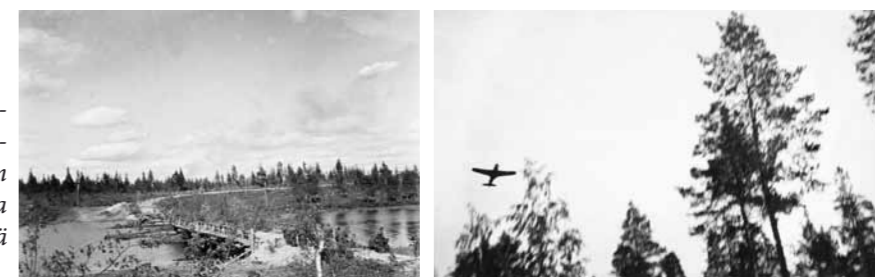
Kevyt Osasto 2:n jälkikärki joutui vihollisen hävittäjän ahdistelemaksi osittain räjäytetyn sillan maastossa 8.7.1941 kello 15.30 lähellä Repolaa.

Kylän lännen ja etelän puolilla sijainneet sillat oli räjäytetty ja poltettu. Repolan kylä paloi vielä osaston saavuttua alueelle. Tuhottujen silta-arkkujen päälle rakennettiin nopeasti heinäladoista puretuista hirsistä polkusillat, joita pitkin pyörämiehet pääsivät yli. Ajoneuvojen matka pysähtyi kuitenkin siltojen länsipuolelle useiden päivien ajaksi ja välttämättömmin huolto kulki pyörillä ja repuissa.