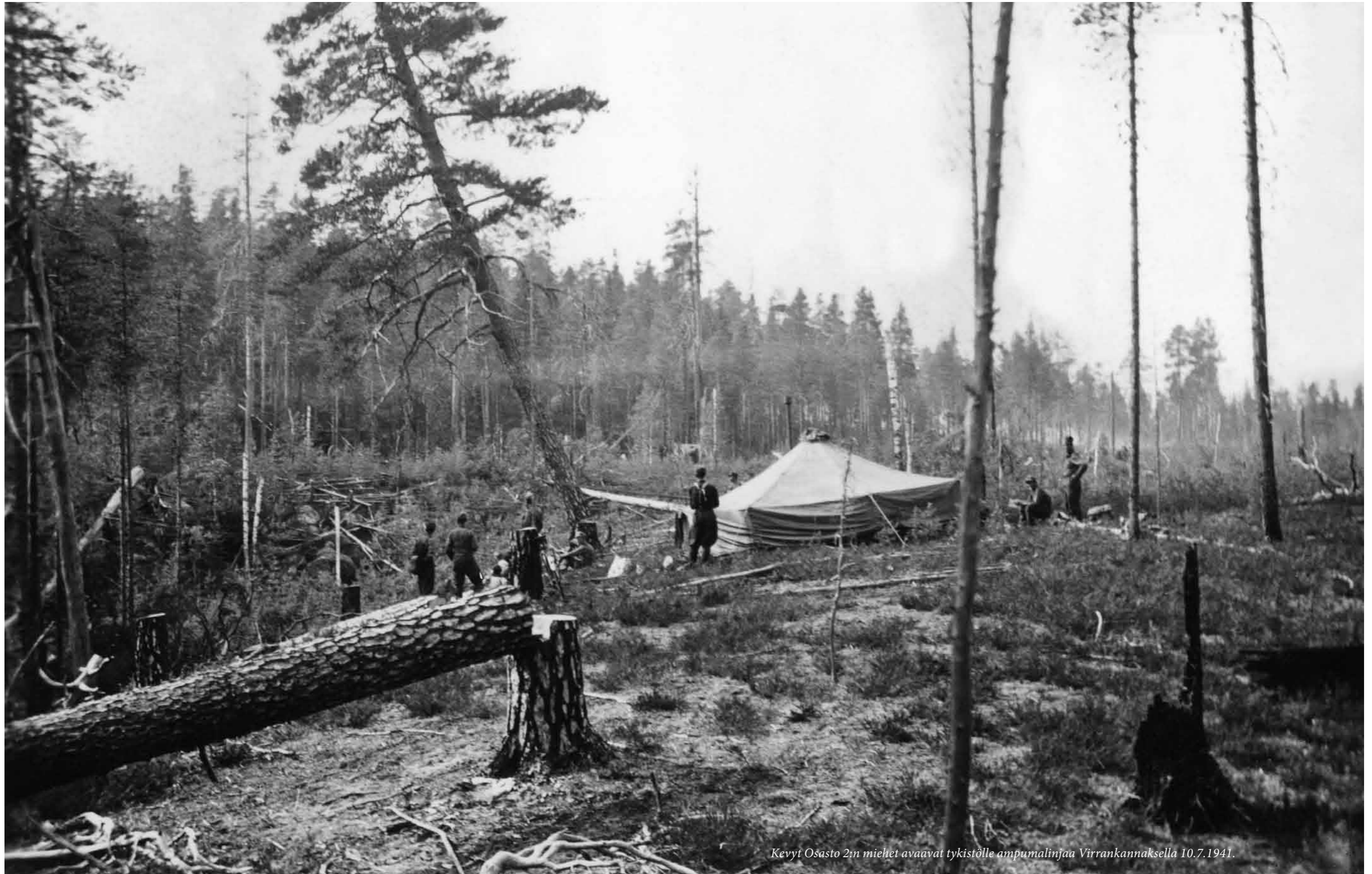
Kevyt Osasto 2:n miehet avaavat tykistölle ampumalinjaa Virrankannaksella 10.7.1941.