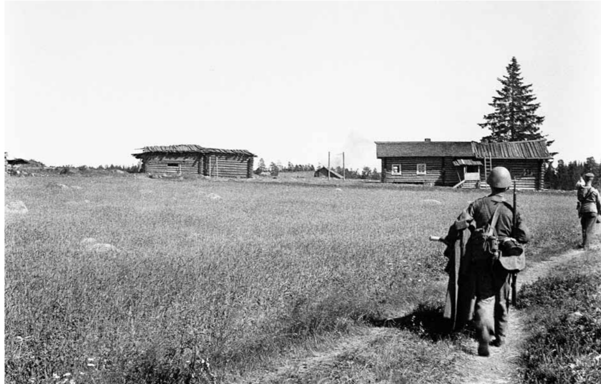
Tyypillinen taloryhmä Virrankannaksella. Kannaksen pohjoispuolella sijaitsee Torosjärvi ja eteläpuolella Lieksajärvi. Kuvassa I/JR 10:n sotilaita. Kuvattu 17.7.1941, jolloin Kevyt Osasto 2 oli jo siirtynyt Porajärven suunnalle.