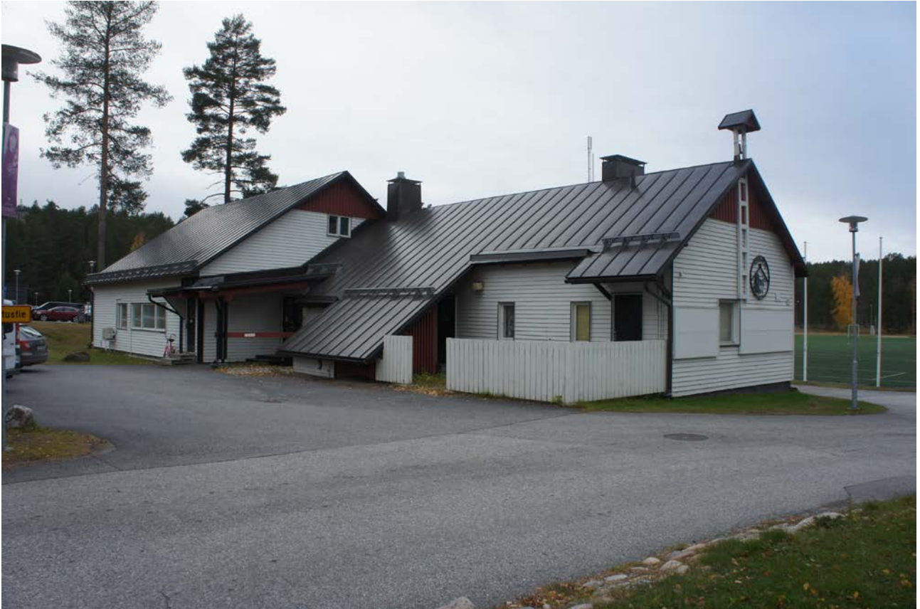
Hallintorakennuksen takana urheilukenttä, minkä reunalle sijoittuvat alla olevat asevelitalot. Kaikkiaan v. 1946 rakennuksia valmistui 7. Laajennus valmistui 1955.