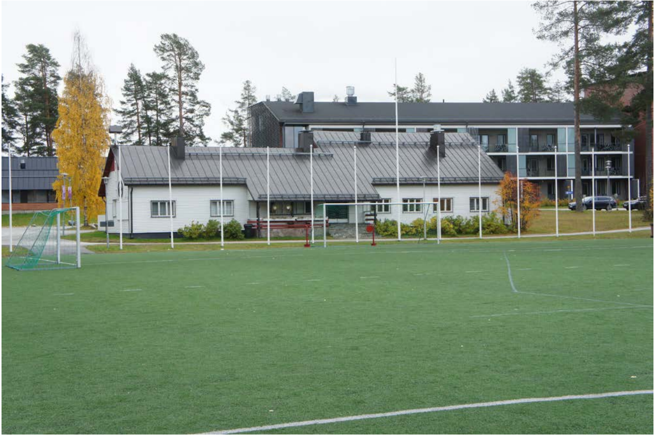
Vuokatin Urheiluopiston hallintorakennus pystytettiin tälle paikalle v. 1946. Urheiluopiston avajaiset pidettiin 23.2.1947. Laajennus valmistui v. 1955.