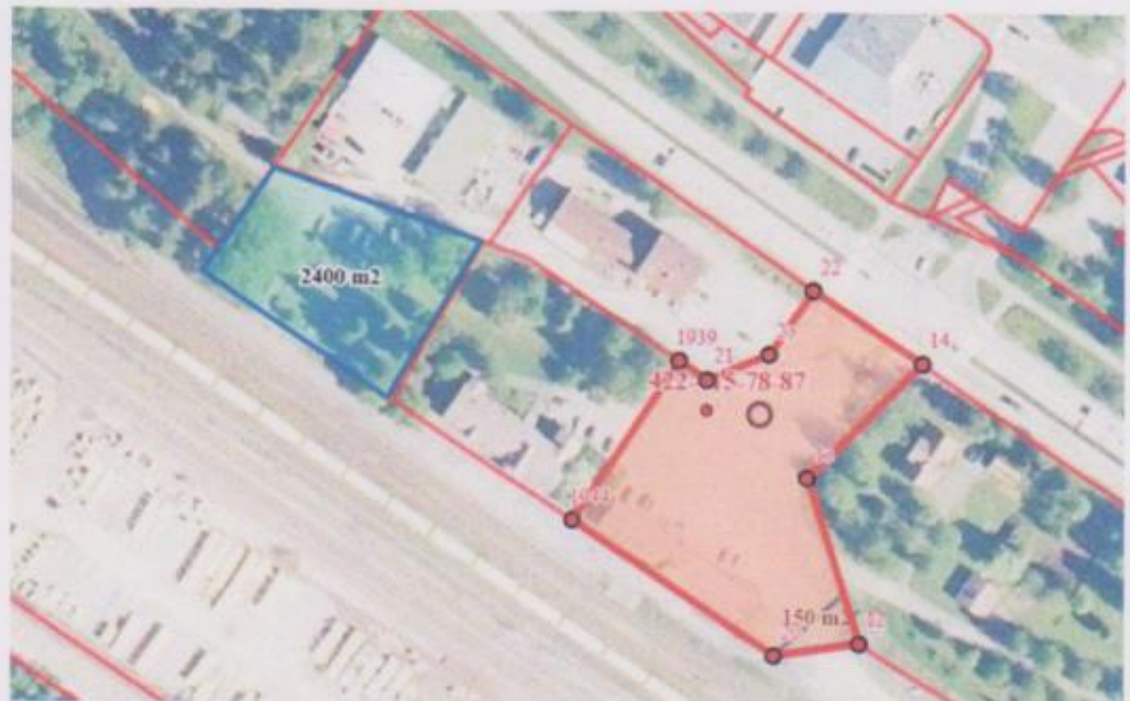
Ilmari Juutilaisen muistomerkkitontti ja yhdistyksen omistama tontti (422-415-78-87) ja siitä luovutettu Liikennevirastolle oleva ala.