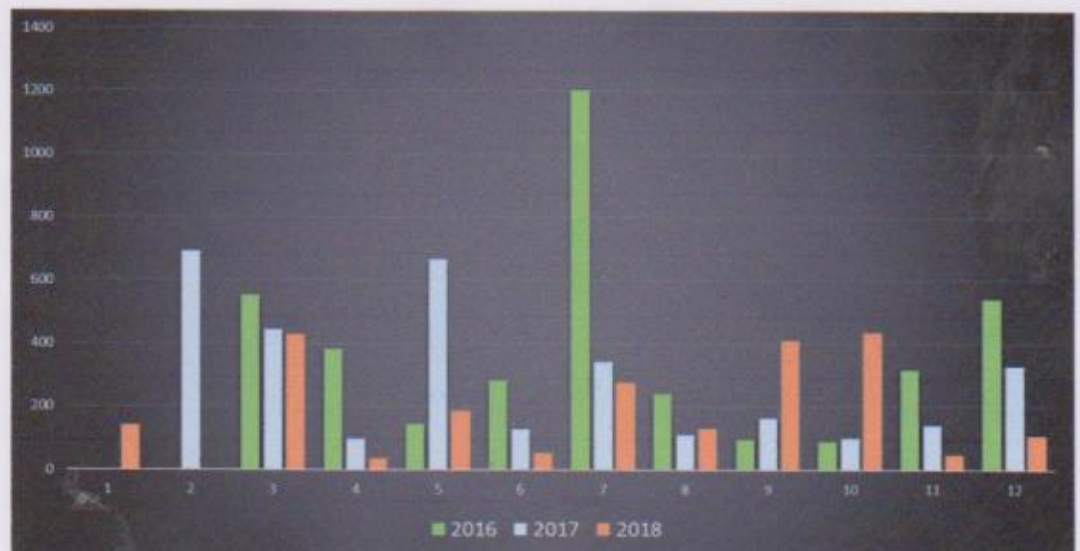
Iisalmen Rukajärvi-keskuksen tuotto vuosina 2016, 2017 ja 2018.