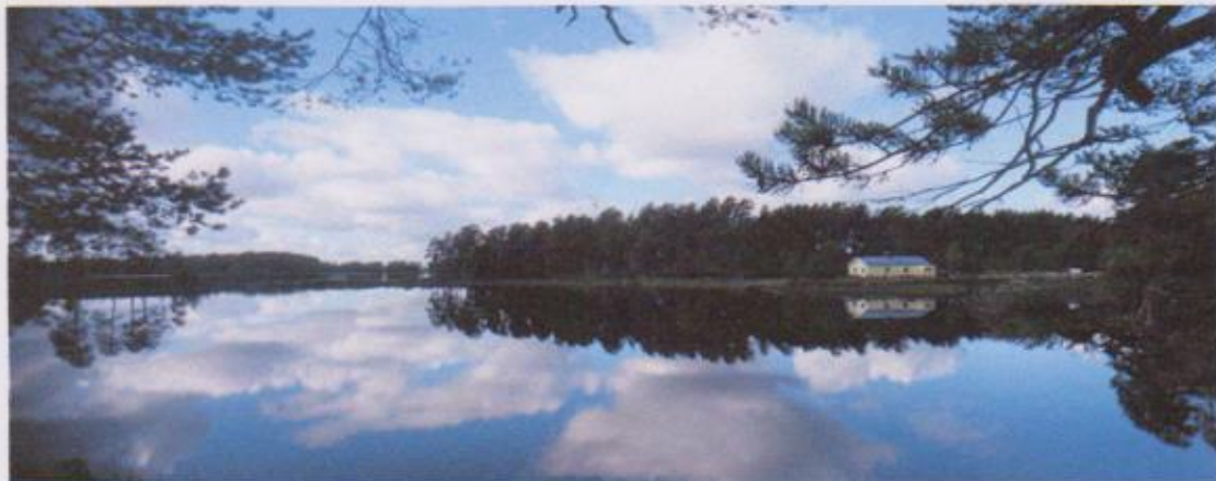
Tiikan Novinkan maisemaa Raappanan majan niemeltä kuvattuna. Edessä on ranta, jossa sijaisti Rukahovi.