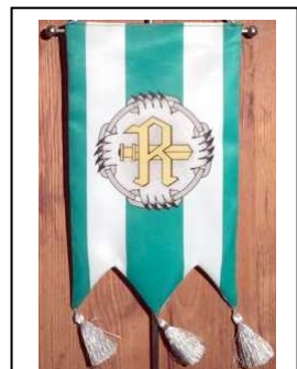
Rukajärven suunnan veteraanitoimikunnan standaaari 1987. Sen otti käyttöön v. 2004 lopulla perustettu ja 8.2.2005 rekisteröity 14. Divisioonan perinneyhdistys ry. Lipussa on samat värit.