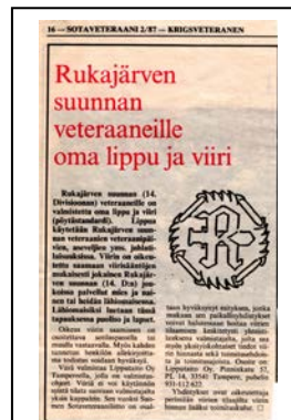
Sotaveteraanilehden 2/1987 julkaisu. Perttuli ei pitänyt väritystä onnistuneena, minkä vuoksi hän valmistutti Rukajärven suunnan historiikkitoimikunnalle oman standaarin. Perttuli hyväksyi RSHYry:n standaarin värit.