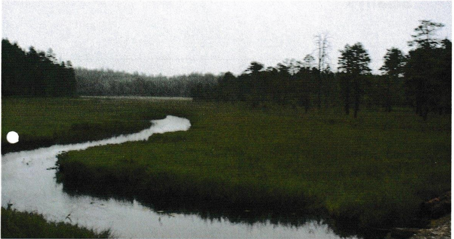
Papinjoki, Kv "Joen" maisemaa 2016